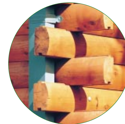
エンジニアード (マシンカット) 相互に重なる

く(Dプロフィール)、あるいは両側とも平たく製材されます。角は相互に重なるか四角に切断するかします。