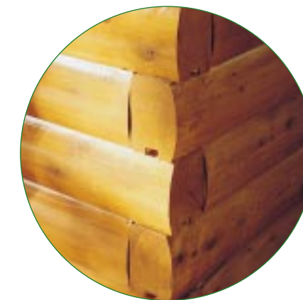
エンジニアード (マシンカット) 四角に切断